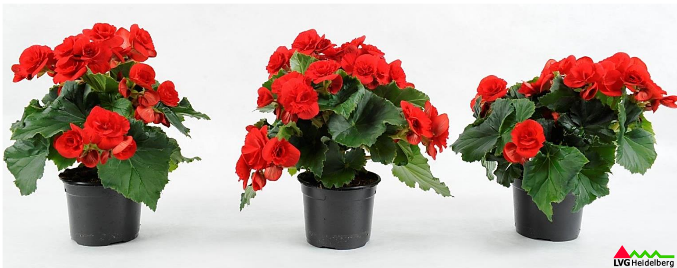
Abb. 1: Begonien 'Barkos' im Torfsubstrat, torf reduzierten und torffreien Substrat (v.l.n.r), verkaufsfertig in KW 30