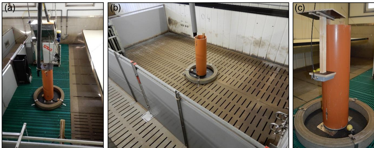
Abbildung 1: Beschäftigungsturm in (a) einer Aufzuchtbucht, (b) einer Mastbucht und (c) mit ausgebauter UHF RFID Antenne.

Die statistische Datenauswertung erfolgte anhand der Software R. Zur Auswertung der Beschäftigungsdauer wurden lineare gemischte Modelle verwendet, während die Daten der Schwanzbonituren mit generalisierten gemischten Modellen ausgewertet wurden.