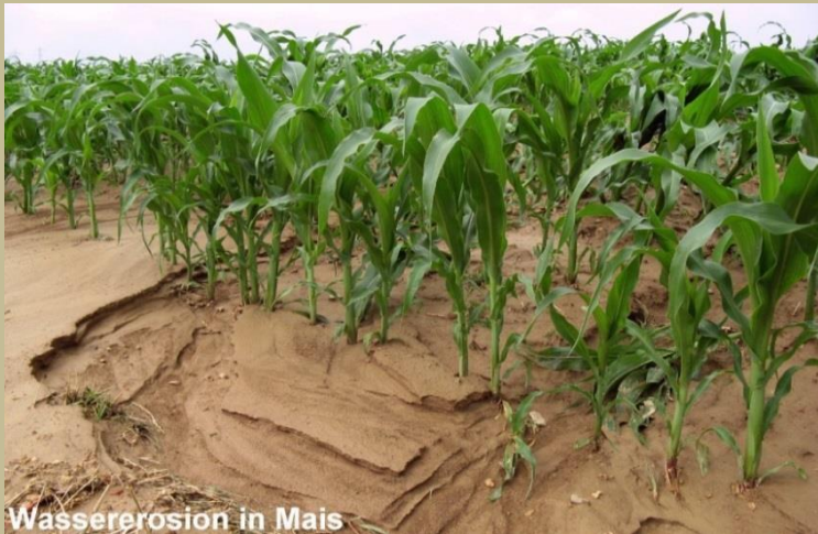
Wassererosion in Mais