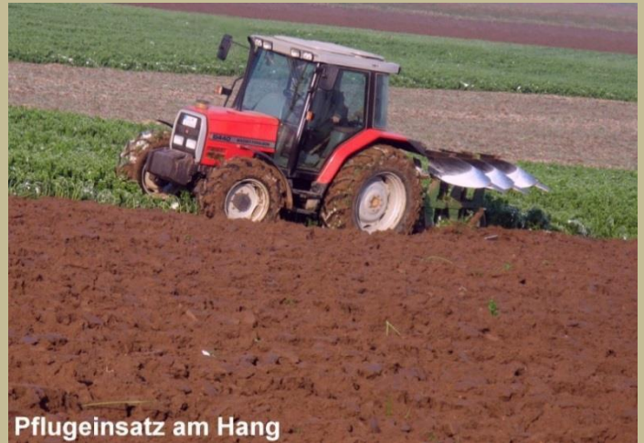
Pflugeinsatz am Hang

ACHTUNG: Neue Berechnung der Erosionsgefährdung seit 2018 - Bitte prüfen Sie Ihr Flurstücksverzeichnis!